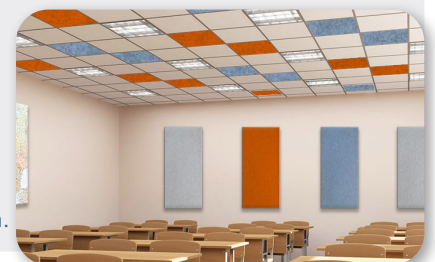
Decke: soni COLOR RD / Wand: soni COLOR